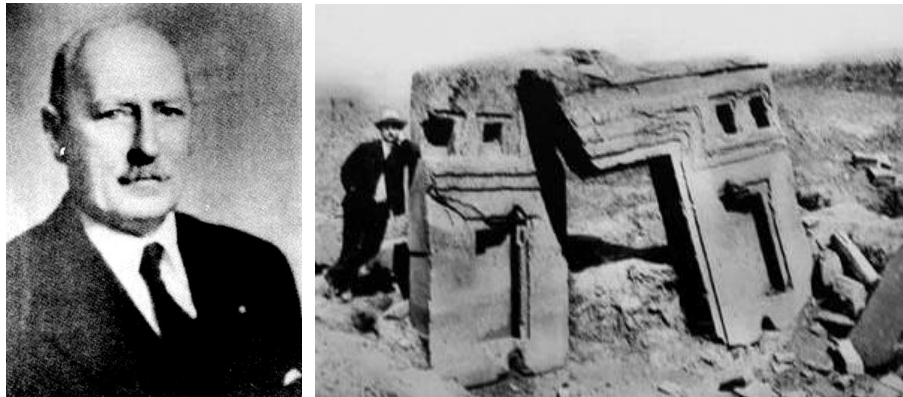
Izquierda: El multifacético Arthur Posnansky. Derecha: Posnansky junto a la Puerta del Sol de Tiahuanaco (Ca. 1910).

En este período, Posnansky comenzó a desarrollar acaso los más importantes estudios sobre Tiahuanaco, la metrópolis de los viracochas , ciudad prediluvial con una antigüedad de alrededor de 14.000 años.