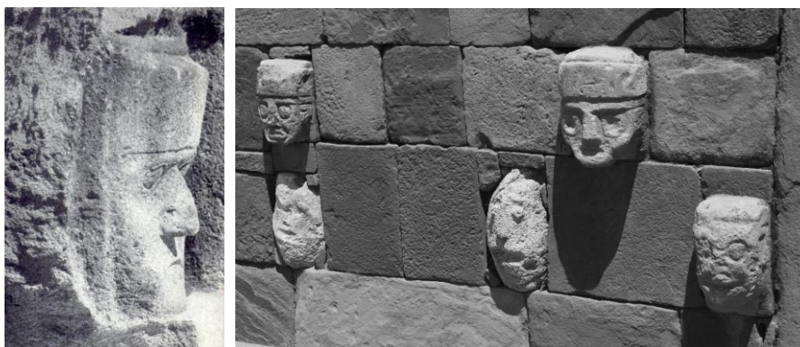
Los viracochas de Tiahuanaco. Izquierda: Busto lítico encontrado por Posnansky en el interior del Templo del Sol de Kalasasaya, en Tiahuanaco (Ca. 1910). Derecha: Algunos de los rostros adosados a las murallas del templete semisubterráneo de Kalasasaya.

A consecuencia de la última gran catástrofe planetaria o Diluvio , esta remota civilización aborígen emprendió una fatigosa migración hacia otras latitudes en búsqueda de nuevas zonas habitables. Los resabios de este grupo -los indios blancos - fueron mayormente absorbidos por las posteriores oleadas inmigratorias asiáticas.